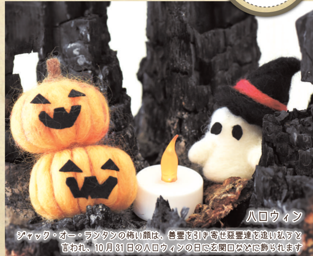
ハロウィン ジャック・オー・ランタンの怖い顔は、善霊を引き寄せ悪霊達を追い払うと言われ、10月31日のハロウィンの日に玄関回などに飾られます