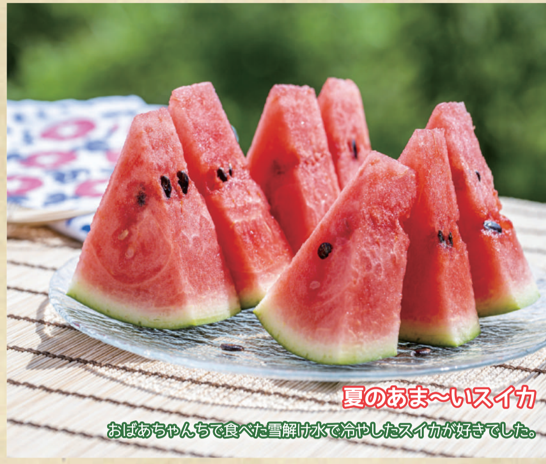
夏のおま〜いスイカ おばあちゃんちで食べた雪解け水で冷やしたスイカが好きでした。