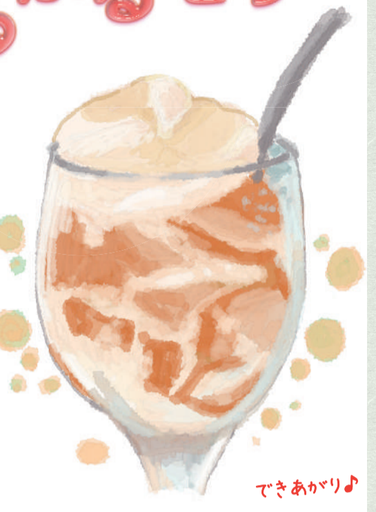
できあがり♪ 甘さのないさっぱりとしたゼリーなのでお好みでアイスを添えてお召し上がりください。